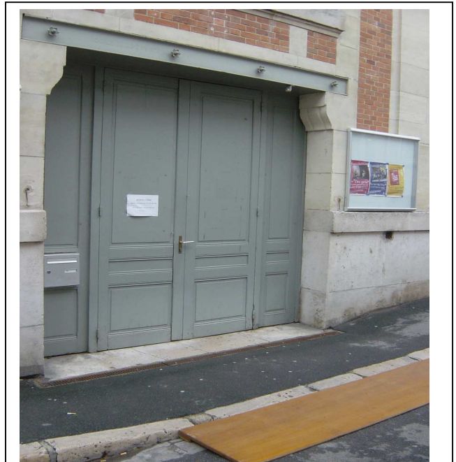
Rue Richelieu : Porte "anonyme" d'accès au bureau de vote des PMR