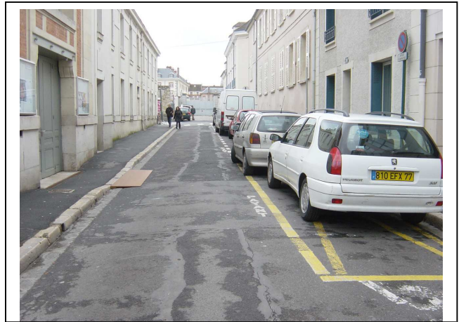
Rue Richelieu : pas de stationnement réservé aux PMR