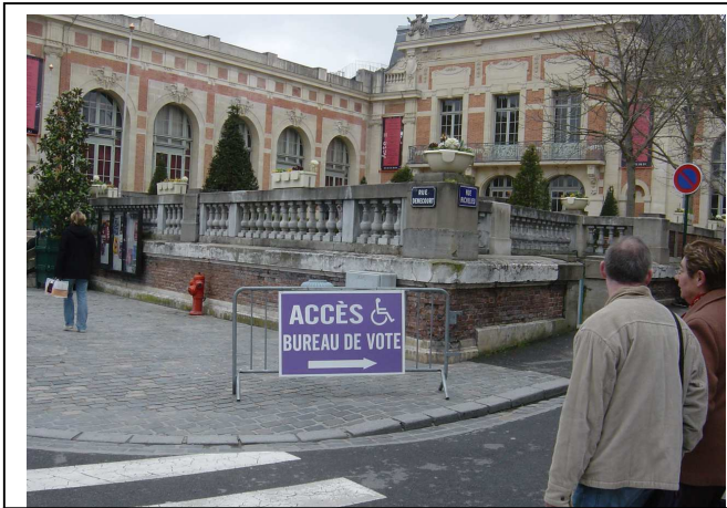
Rue Denecourt : seul panneau indiquant l'accès pour PMR